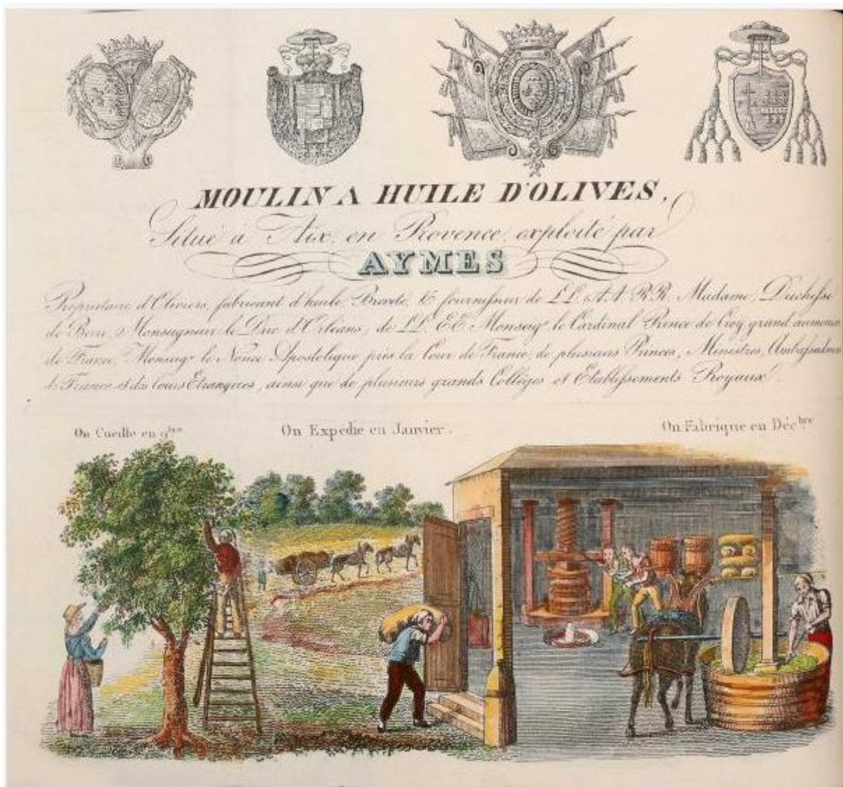
Planche 1/3 extraite de l'édition du 1er Août 1828.