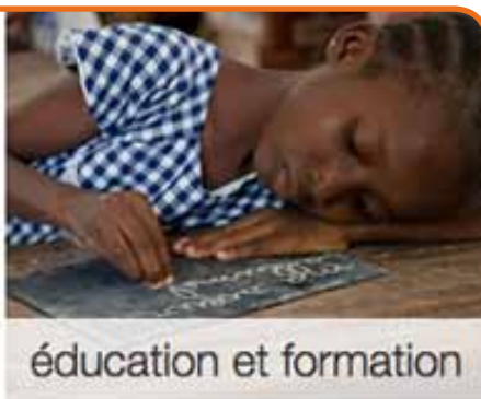
éducation et formation