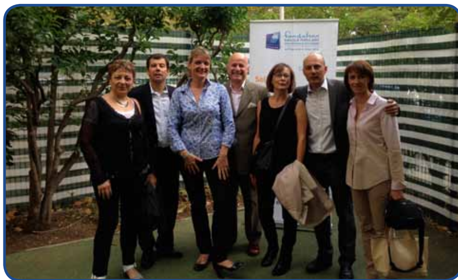
Une partie des membres de la Fondation à l'inauguration de la Maison des Assistantes Maternelles

Dernier axe d'approche de la Fondation BPPC , l'appel à projet. Si beaucoup de fondations ne fonctionnent que par ce biais pour trouver des actions à financer, la Fondation BPPC n'en émet qu'un par an, à chaque fois sur une thématique spécifique. Celui financé en 2013, Marseille Capitale de la Culture oblige, portait sur « la culture et l'insertion ». Les nombreux projets réceptionnés passent à travers le filtre de plusieurs jurys, composés de sociétaires et de spécialistes du thème choisi. Au final une dizaine de lauréats sont récompensés, avec une enveloppe globale de 60 000 euros. Notons une spécificité là aussi de la Fondation BPPC , qui décidément réfléchit bien en terme de projet. Le montant de la dotation n'étant pas connu à l'avance, chaque candidature soumet sa propre demande de financement. Il n'est alors pas impossible que l'association classée première reçoive moins d'argent que celle arrivée troisième ou quatrième, puisque la Fondation leur alloue à chacun le montant demandé. Pour que le projet se pérennise et serve d'exemple pour d'autres initiatives. ■ H. A.