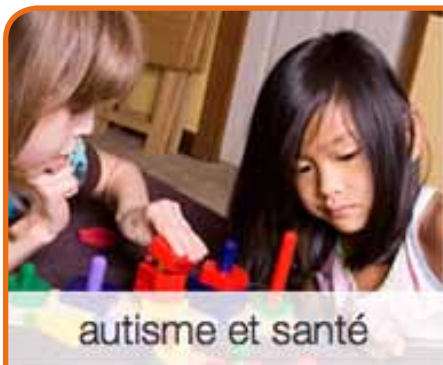
autisme et santé