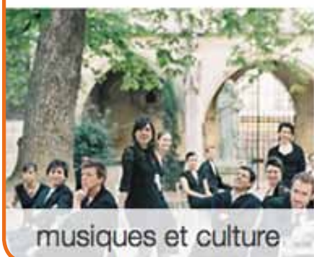
musiques et culture