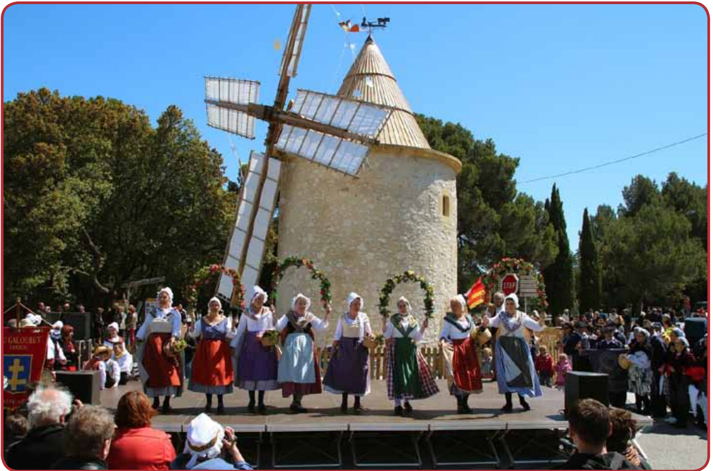
L'inauguration du moulin, le 26 mai 2013.

Près de 30 000 € ont été apportés, eux, par les habitants de Lambesc, via la Fondation du Patrimoine. Un montant énorme, qui témoigne aussi bien de l'implication des habitants et des commerces de la commune que de l'inventivité et de la pugnacité de l'association Conservation du Patrimoine de Lambesc . Chacun y est allé de son geste. Le béton a été offert par une entreprise locale, la coopérative viticole a mis à disposition un local pour la taille des pierres et a créé une cuvée spéciale moulin, le centre commercial a mis en vente de la charcuterie au bénéfice de la restauration... Cette dernière consistant notamment à refaire toute la couronne chapeautant le moulin, l'association a eu l'idée très originale de proposer à chaque habitant de s'acheter sa pierre parmi les 40 à poser. Pour 250 €, leur nom fut gravé dessus, un témoignage de leur implication qui restera dans le temps. Autant de petites actions, trop nombreuses pour être toutes citées, qui ont poussé chaque lambescain à faire cause commune autour de la restauration de ce moulin de Bertoire. Une effervescence qui s'est matérialisée le jour de l'inauguration, qui a accueilli plus de 1 000 habitants le 26 mai der-