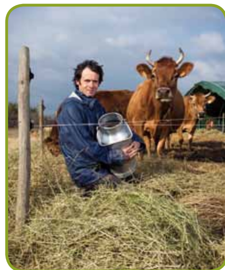
La Fondation Macif s'est notamment impliquée dans une plateforme innovante de produits locaux.

ainsi qu'en 2012 elle a alloué pour 4,1 millions d'euros de dons au secteur de l'ESS. En région (PACA-Corse-Languedoc), ce sont plus de 172 000 euros qui ont été distribués à 18 structures, pour une moyenne de subvention de 9 500 euros.