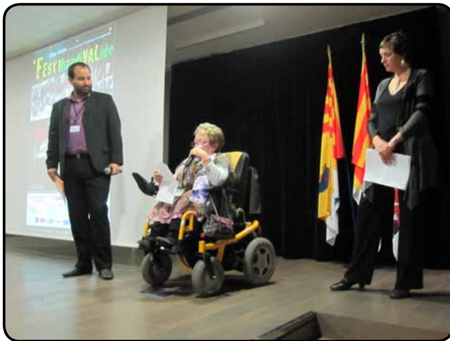
La seconde édition FestiHandiValide s'est déroulée le 22 novembre 2013 au Mazarin

Dans le cadre de son appel à projets « Vivre ensemble pour partager nos différences », la Fondation SNCF a notamment travaillé avec la Maison des Associations d'Aubagne et Pays d'Aix Associations, via le RNMA (Réseau National des Maisons des Associations). Notre mission? Diffuser l'information, sélectionner les projets éligibles et les accompagner dans la réalisation du dossier de candidature. Ce dernier est passé ensuite par le premier filtre du RNMA, avant d'être remis au correspondant régional de la Fondation, Philippe Dijol. 2 des 3 projets présentés par Pays d'Aix Associations cet été ont été sélectionnés, portés par Airelles Vidéo (Aix-en-Provence) et l'association EFI (Enfance, Famille, Insertion) de La Ciotat. Présentation de ces 2 associations et de leur investissement pour le mieux-vivre ensemble.