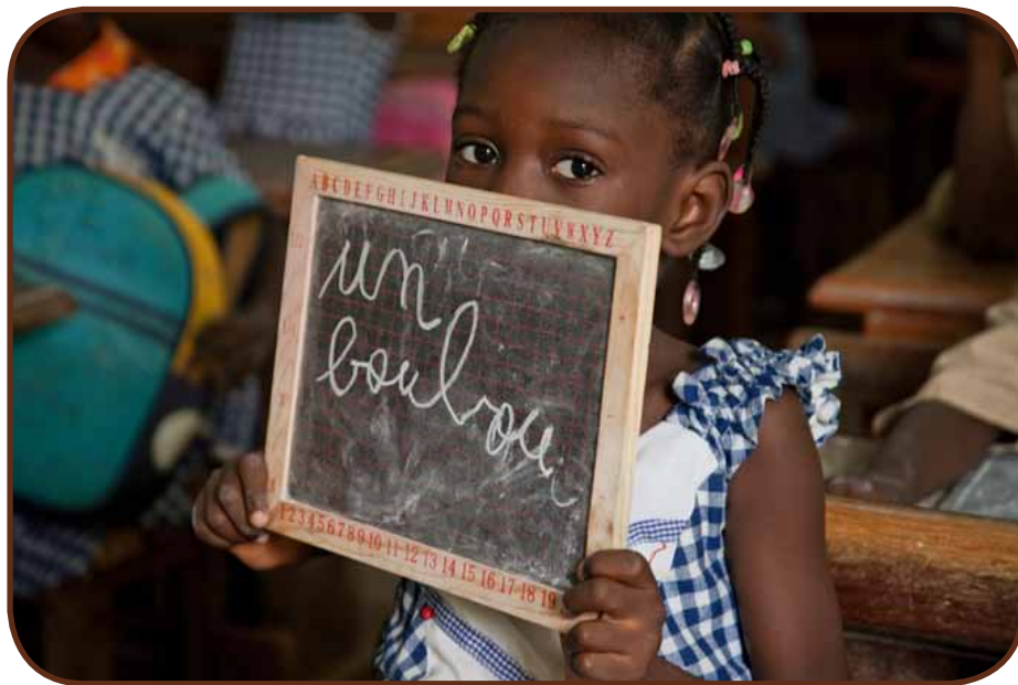
L'Humanitaire ne représente que 2 % d'un mécénat d'entreprises qui privilégie les actions locales

L'essor du mécénat date des années 60, avec la création de la Fondation de France. La Fondation la plus connue, reconnue d'utilité publique, a pour missions de recueillir des dons privés et de les redistribuer en finançant des actions d'intérêt général. Elle représente aujourd'hui 448 000 donateurs et 715 fonds et fondations sous égide, pour un montant total de plus de 150 millions d'euros. Mais il va falloir attendre la Loi Aillagon du 1 er août 2003, pour