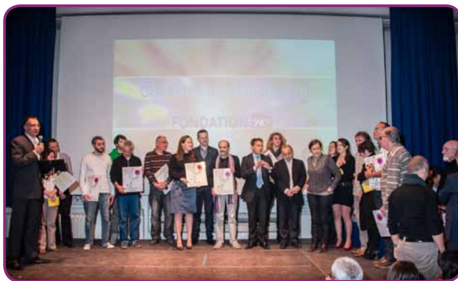
Prix Fondation SNCF 2013 - PACA

C'est pourtant une autre raison qui a poussé la SNCF à créer une Fondation, en 1995. L'objectif était alors d'aider les cheminots à exprimer leur solidarité, de les soutenir dans leur engagement associatif. Il ne s'agit d'ailleurs pas à l'époque d'une fondation d'entreprise, mais d'une fondation placée sous l'égide de la Fondation de France, chargée de la gestion des fonds alloués. C'est en 2001 que la Fondation SNCF devient une fondation d'entreprise. Autonome mais toujours au service de ses cheminots, sa raison d'être étant « d'encourager et soutenir les actions bénévoles externes, initiées ou