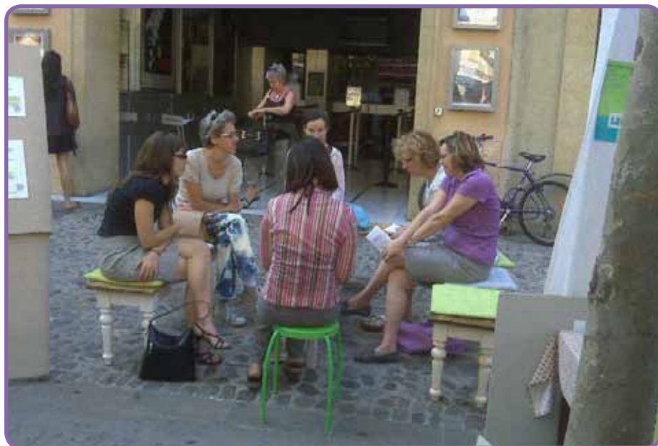
Un groupe de paroles improvisé lors d'Assogora

Parallèlement à ses groupes sur la parentalité et la famille, Aslya anime différentes actions de soutien et d'accompagnement : théâtre parents/ados avec la Compagnie des 4 Dauphins, « Mots en jeu » avec l'association Assami et le Théâtre du Jeu de Paume, ciné-débats..., autant d'initiatives dont vous pouvez retrouver le détail et le calendrier sur le site de l'association, www.aslya.fr . ■ H. A.