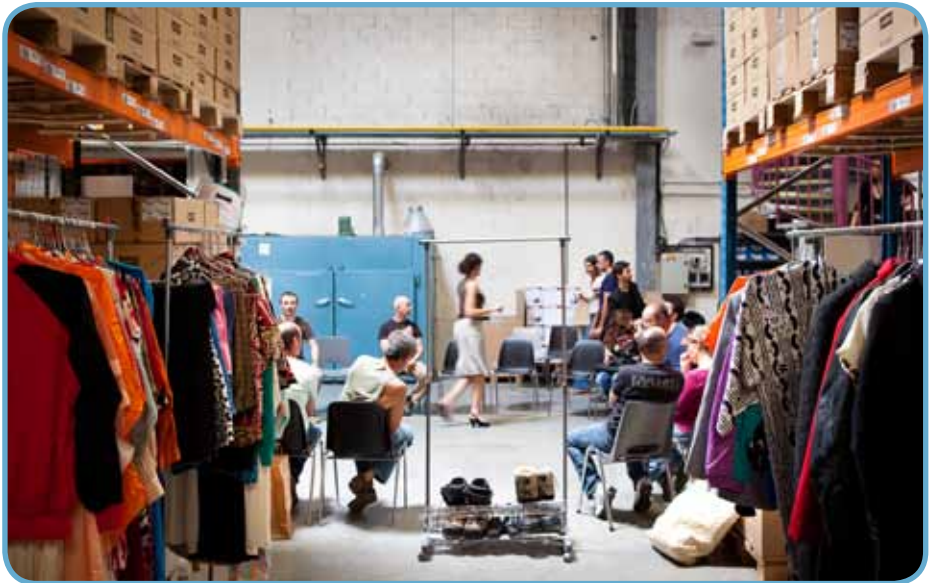
Atelier dans avec les salariés de Pébéo en 2010, proposé par la C ie Projet In Situ, lauréat 2009

international en musiques actuelles, Watt! a initié des résidences de musiciens à l'étranger puis sur le territoire. Mécènes du Sud a accompagné le mouvement avec le projet Archipels 2013, au cours duquel ses entreprises